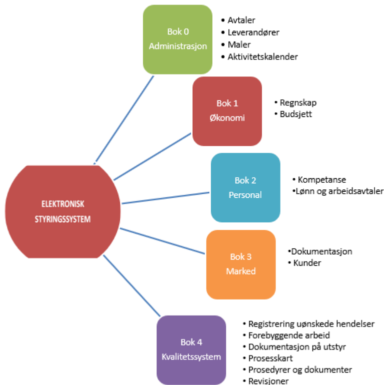
fig. Mappestruktur Styringssystem

Daglig leder og Kvalitetsleder er ansvarlige for at systemet fungerer optimalt, og til enhver tid er oppdatert og tilgjengelig for alle ansatte.